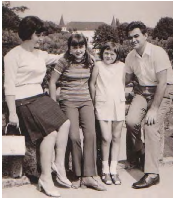
Porodica Sekulić, Banja Koviljača, 1975

poveljnik naj bi pred tem že pretekel 15–20 km, potem pa so zaslišali njegov gromki glas: »Gardisti, za menoj!« Sledilo je še pet ali več kilometrov teka v uniformi, brez premora.