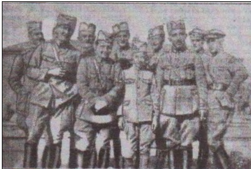
Skupina Slovencev iz 1. jugoslovanskega polka v Tomsku (Življenje in svet, 1927, J. G. v članku Jugoslovanski prostovoljci v Sibiriji)

Objavil je tudi fotografijo skoraj legendarnega ameriškega strička – »Mister Bixby-ja«, pripadnika mlade krščanske mladine, ki je v polk prišel kot del zavezniške vojaške in kulturne pomoči, saj je od Tomska naprej skrbel za kulturno in zabavno življenje naših prostovoljcev.