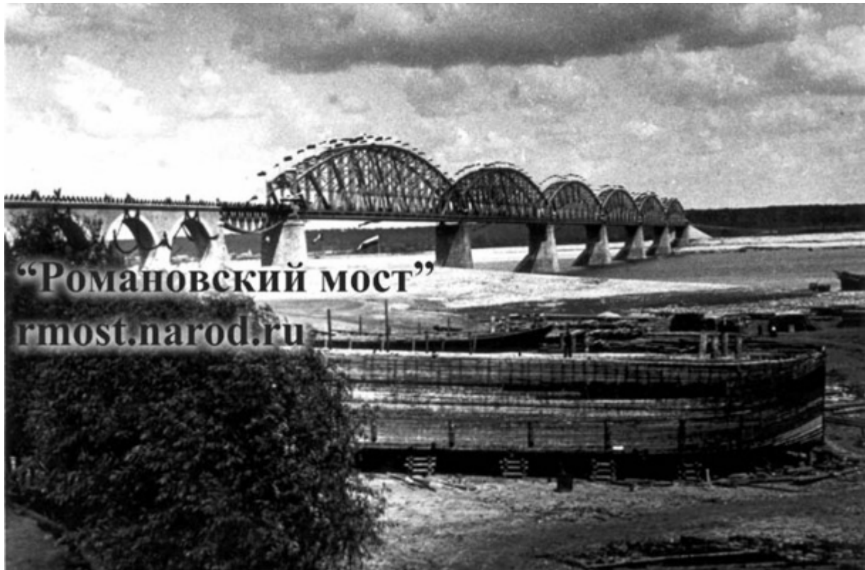
Romanovski most čez Volgo blizu Kazana, 1918

(ruski internetni vir: Moskva – Bačka Palanka, 18. avgusta 2009)