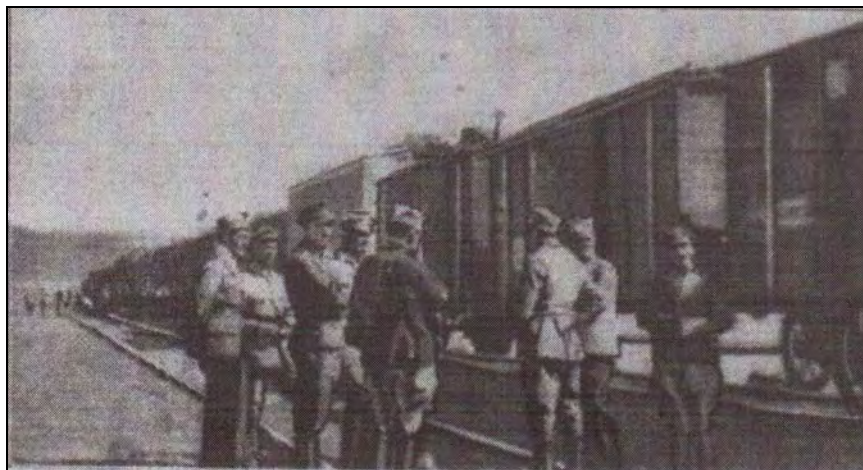
Slovenski dobrovoljci na poti k Bajkalu (Življenje in svet, 1927, J.G. v članku K Bajkalu)