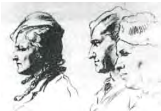
Božidar Jakac: Skice partizank

V odločilnih zgodovinskih trenutkih so se ženske Jugoslavije uveljavile tudi v partizanskih enotah in si tako priborile enakopravnost. Zanimiv je podatek, da je v NOV Jugoslavije, ki je 1945 štela okrog 800.000 borcev, bilo 100.000 žensk, od katerih je ranjeno 40.000 žena (3.000 težki invalidi), padlo (in umrlo zaradi bolezni) pa je čez 25.000 žena. Poleg tega so si ženske med NOB priborile tudi politični status, saj je že 6. decembra 1942 v Bosanskem Petrovcu ustanovljena Antifašistična fronta žena Jugoslavije. Organizacija je bila zelo ugledna, saj je v njej bilo tudi 3.344 nosilk Spomenice, 91 narodnih herojnj in okrog 2.000 častnic in podčastnic JLA.