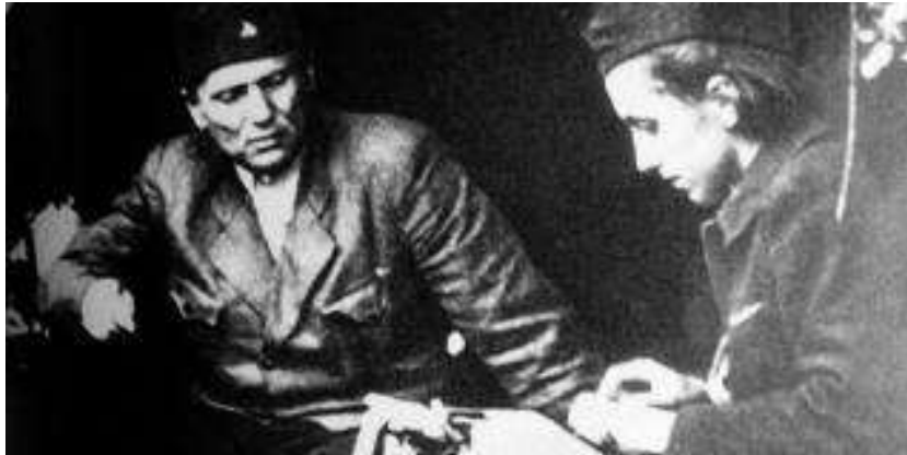
Josip Broz - Tito in Davorjanka Paunovi - Zdenka, 1944

Kmalu zatem sta morala zaradi nastalih razmer (ustaško-partijska zarota 1941) iz Zagreba odpotovati v Beograd. Pokrajinski komite KP Srbije je prevzel skrb za nastanitev Tita v Beogradu (na Čukarici), za vse ostale zadeve pa je poskrbela njegova iznajdljiva tajnica Zdenka. Postala sta tudi ljubimca.