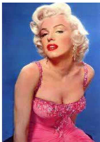
Marilyn Monroe

Slikovna pornografija v JLA je v glavnem prevladovala med vojaki in mornarji, manj med starešinami. V glavnem so prevladovale posterji ameriške filmske igralka Marilyn Monroe, pa tudi nagice iz raznih tujih pornografskih revij. Prednjačili so predvsem vojaki, ki so bili pred tem na začasnem delu v tujini.