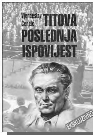
Vjenceslav Cenčić, Titova poslednja ispovijest, Beograd, 2001