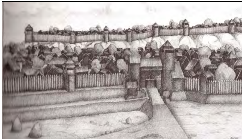
Rekonstrukcija mesta Belsko v Ukrajini, podobno Herodotova Geloma ( Vojaška zgodovina bodočih Slovanov , str. 21)