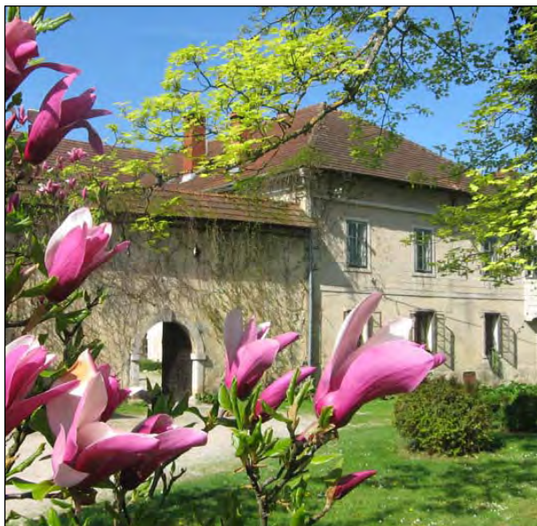
Grad Struge pri Otočcu in Živi muzej (google)

Sicer pa bi lahko rekli da si kruh služi v posebni vrsti pedagoškega turizma, saj je upravitelj gradu Struge pri Otočcu, kjer z Bojano Čibej dela in vodi t. i. Živi muzej. Tam tudi prireja razna znanstvena srečanja.