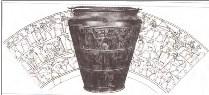
Situla iz Vač z upodobitvami (Vojaška zgodovina bodočih Slovanov, str. 203)

Avtor nam predstavi številne arheološke najdbe na ozemlju sedanje Poljske in Ukrajine, ki potrjujejo Herodotove zapise o utrjenih gradiščih, obdelovanju železa, bronu in medenine, o grobovih (kjer so najdeni meči, bojne sekire, čelade, oklepi) in grških izdelkih, kar kaže na živahno trgovino v tedanjem času. Obenem primerja določene najdbe na slovenskem ozemlju (gradišče Vir pri Stični). Situla iz Vač nam s svojimi upodobitvami nudi izredni vir o slovenski vojaški zgodovini