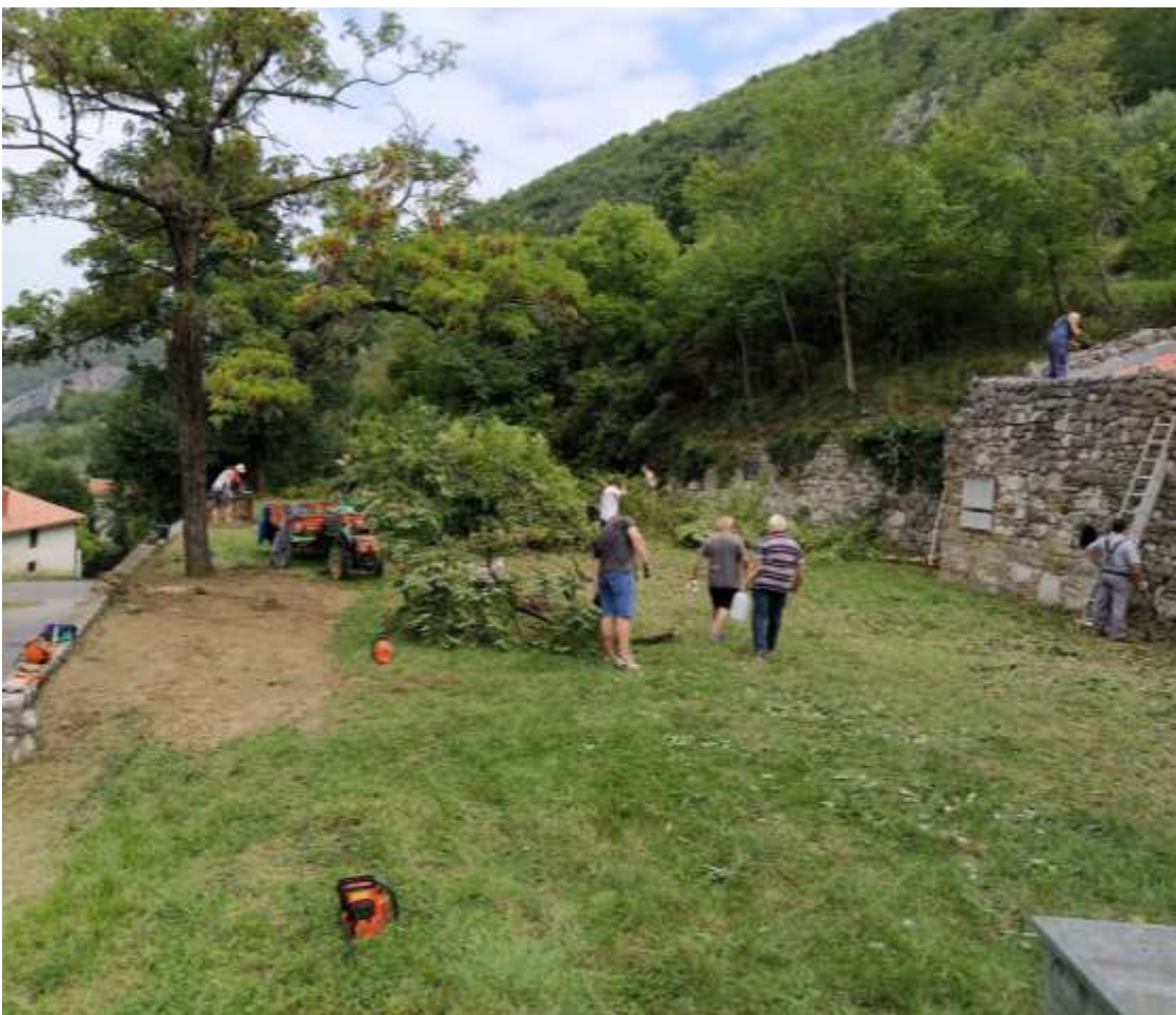
Dela pri obnovi spomenika Partizanska tiskara Žena in urejanje okolice za nov prireditveni prostor v Stari Gabrovici.