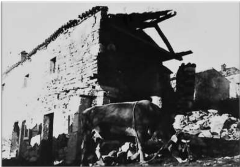
Po požigu vasi.

Spomin na zoglenela trupla ... na tisto malo trupelce ... preveč hudo je bilo. Ko sem jo vprašal, kako je prišla v Rižarno, taborišče smrti s krematorijem, sem jo tako rekoč sprostil iz oklepa tistih misli.