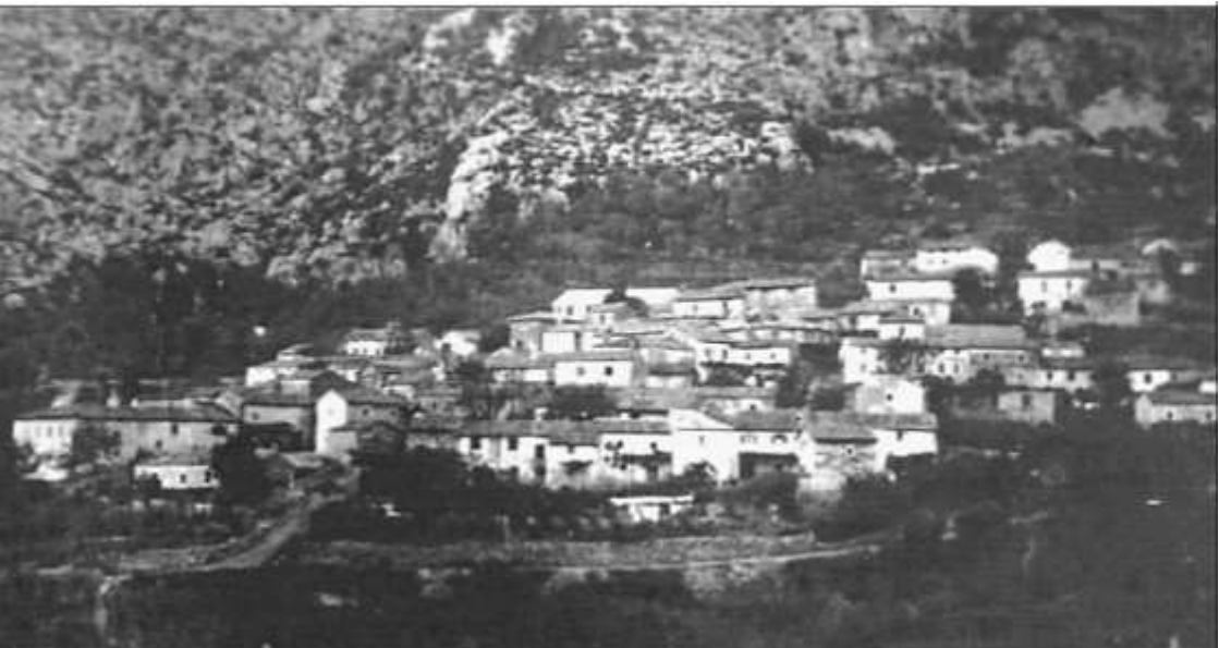
Gabrovica pred požigom.