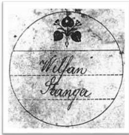
Volilni listek za listo JNS. Jugoslovanska narodna stranka), imenovano tudi Lipa ali Lipova vejica.

Slednji dogodek je še vedno neraziskan, pa čeprav je bil en uporni vaščan mrtev. V knjigi Slovenska Istra v boju za svobodo piše le, da so 12. maja 1921 fašisti že drugič vdrli v hišo zaupnika JNS v Črnem Kalu ter z revolverji zahtevali volilne glasovnice. Po končani preiskavi so pred hišo zažgali vse listine in zapiske, ki so jih našli v stanovanju. Ogenj je privabil vaščane, ki so bili prepričani da gre za požar. Fašisti so jih s streljanjem in ročnimi bombami razgnali in enega ubili.