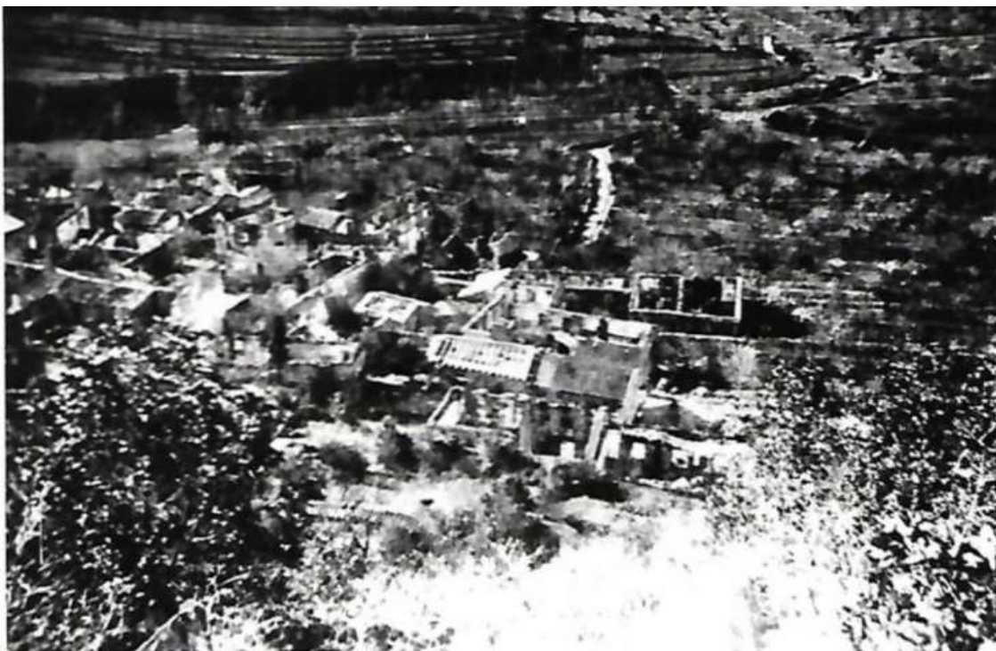
Pogled z Griže na požgano Gabrovico, kot jo je 29. maja 1944 fotografiral Stanko Pervanja – Gruden.. Vir: fototeka Pokrajinskega arhiva Koper