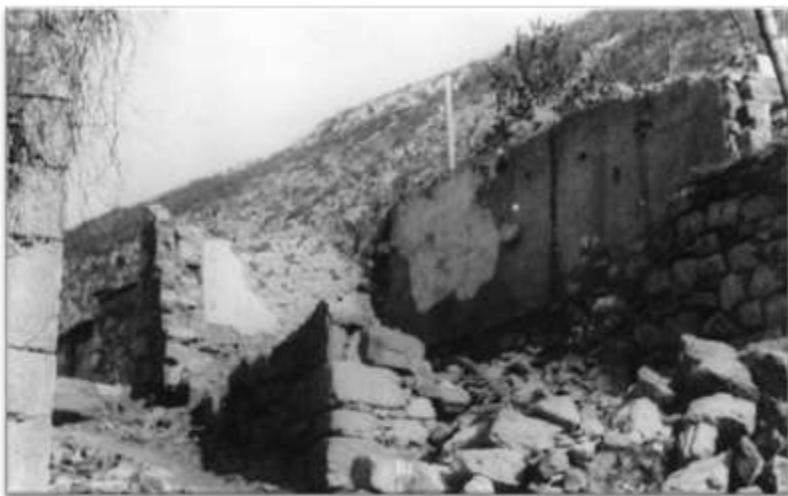
Ruševine Gabrovice.