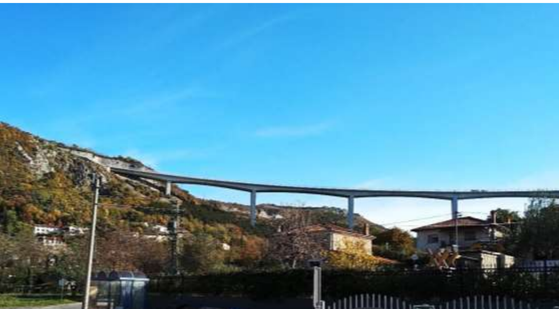
Gabrovica, levo pod steno Stara Gabrovica, desno hiši Nove Gabrovice.