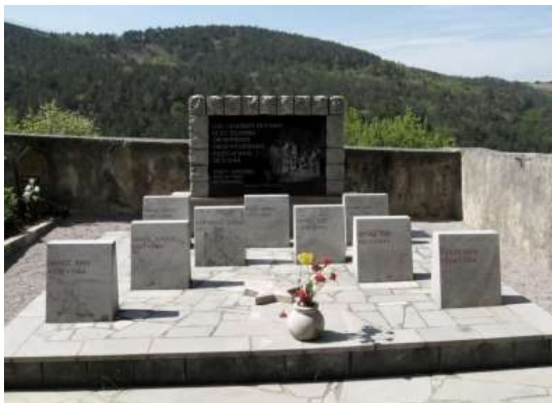
Skupni grob žrtev požiga Gabrovice.

Bilo je dete štirih let. Bila je deklica pomladni cvet. Bila je sonček za ta svet. Čemu je morala umret?«