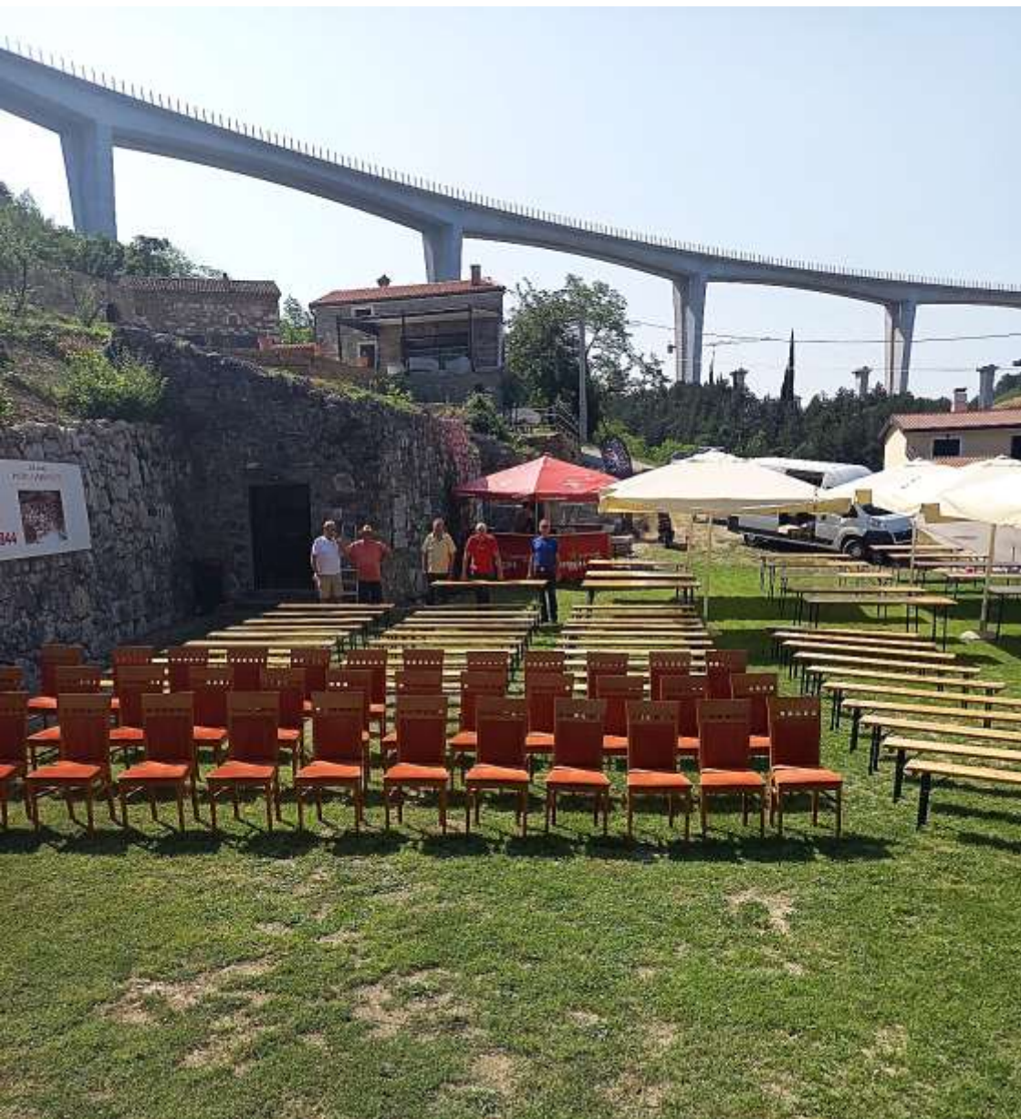
Na novo urejene prireditveni prostor pred bunkerjem tiskarne čaka na udeležence proslave 28. 5. 2023.