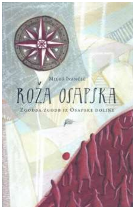
Naslovnica knjige Roža osapska.

V Gabrovici pa je bila Jugoslavija, od tiste ameriške pašte in tudi tržaškega placa so jih ločevali dve meji in veliko vojakov