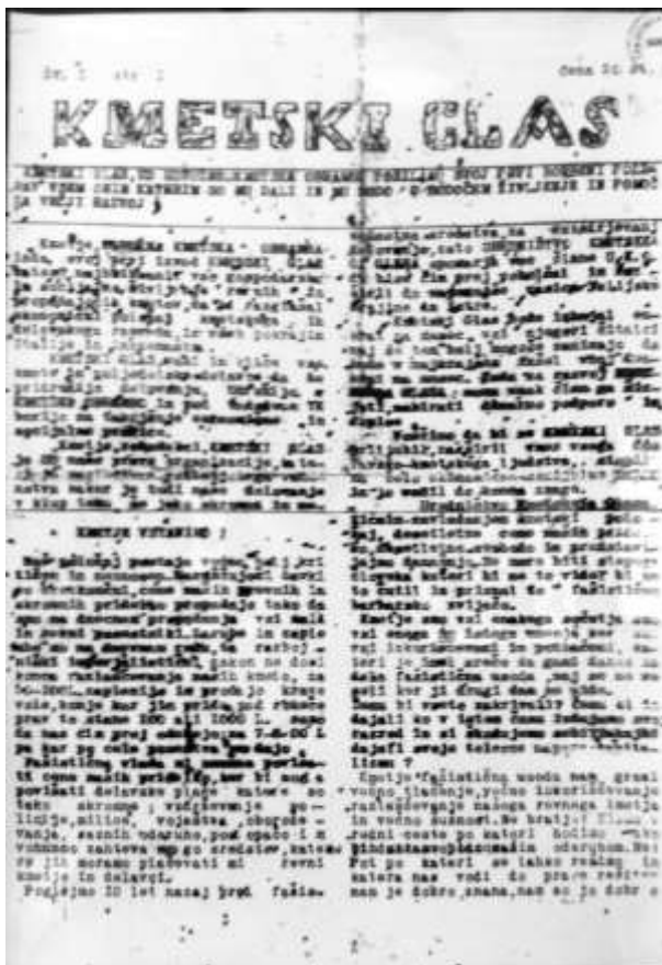
Prva stran prve številke časopisa Kmetški glas.

Fašistična vlada ni zmožna povišati cene naših pridelkov, ker bi morala povišati delavske plače, ki so skromne; vzdrževanje policije, milic, vojaštva, oboroževanje raznih ovaduhov, postopačev – vse to zahteva mnogo sredstev,