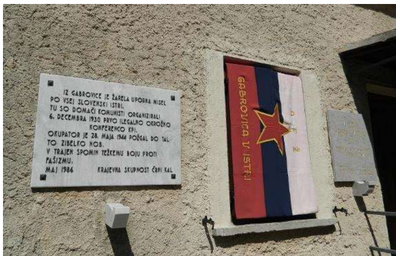
Plošča na stavbi vaškega doma v spomin na požig in prapor vaše organizacije AFŽ (Antifašistične zveze žena), ki ga je sama naredila.