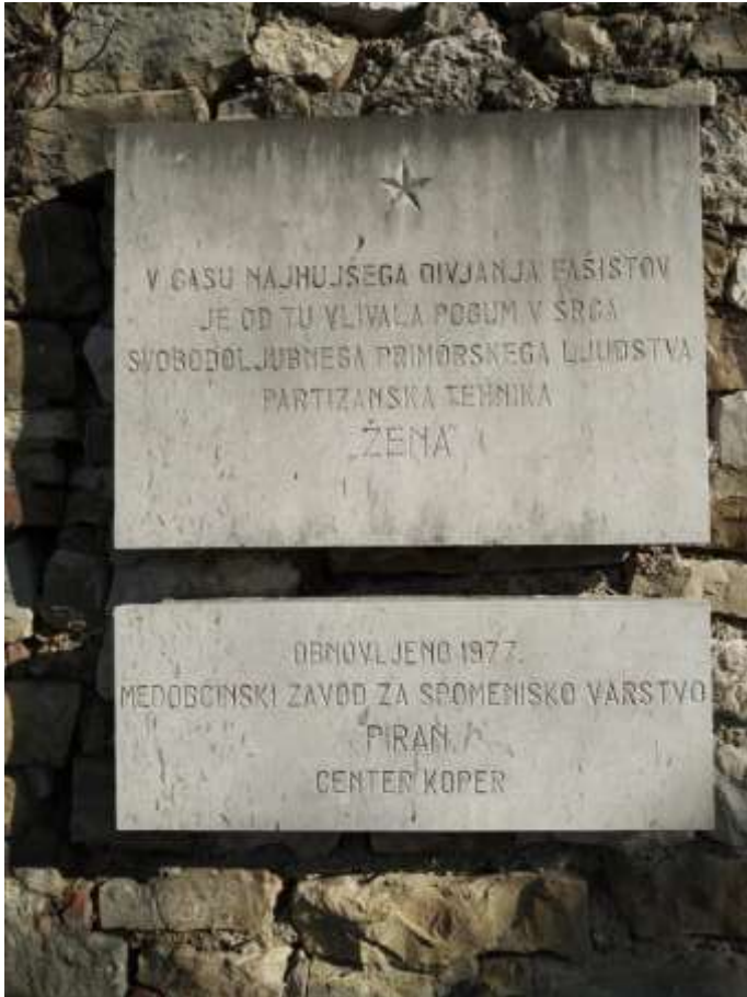
Spominski plošči na dvorišču tiskarne Žena.

se je nato preimenoval v Snežnik, ko pa so jo v Barutovem bunkerju še razširili, so ji rekli kar Žena.