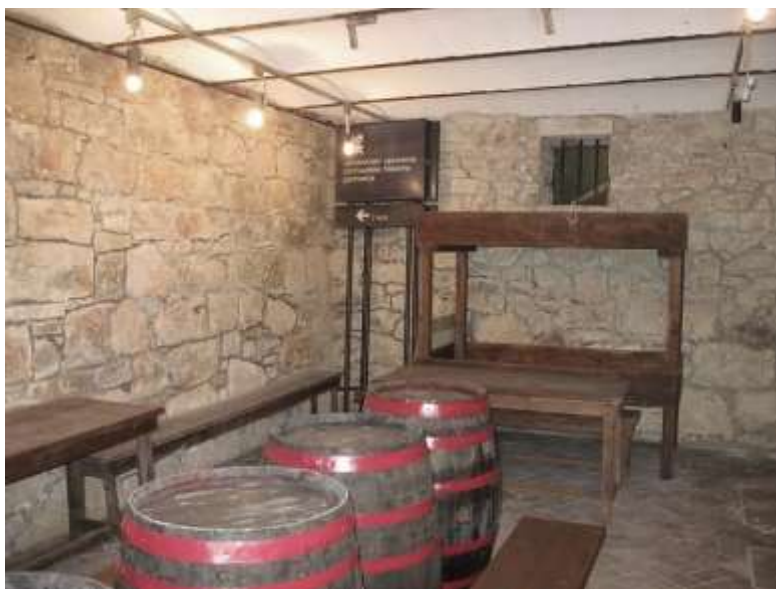
Slika: Notranjost obnovljenega bunkerja - tiskarne Žena I. 1984. Slika na naslednji strani: replika notranjosti bunkerja tiskarne Žena v Pokrajinskem muzeju Koper.