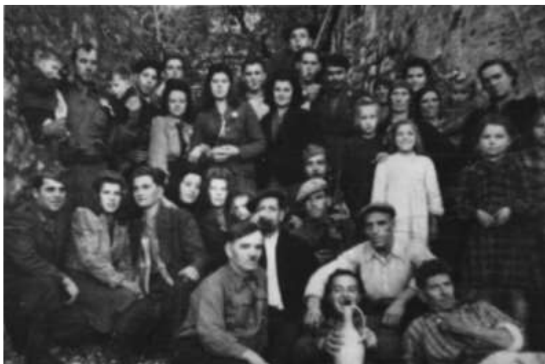
Gabrci leta 1943 ob propadu fašistične Italije.