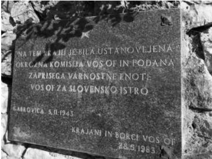
Spominska plošča Varnostno-obveščevalni službi Osvobodilne fronte.