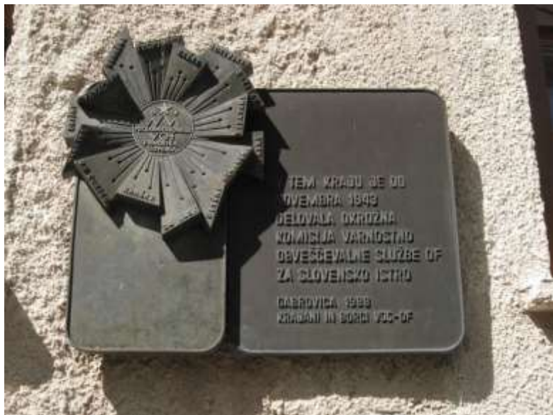
Spominska plošča pokrajinski komandi VOS-a na vaškem domu v Gabrovici.