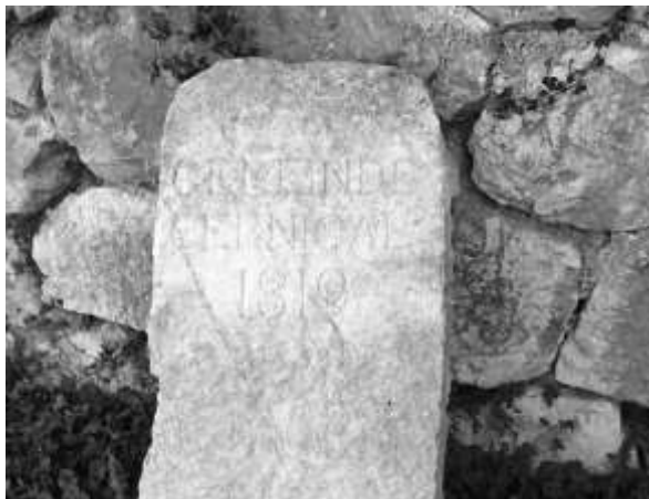
Mejni kamen med Gabrovico in Črnim Kalom, na katerem je še viden napis iz stare Avstrije GEMEINDE ČERNI KAL ali OBČINA ČRNI KAL in letnica 1819.

Gabrovico pri Črnem Kalu danes sestavljata dve naselji, ki jima domačini pravijo Stara in Nova Gabrca, sebi pa Gabrci oziroma Gabršce. V obeh naseljih jih danes živi le nekaj desetih, pred prvo svetovno vojno, ko jih je bilo največ, pa so zabeležili 280 duš in dvakrat več govedi. Stari del naselja ali Stara Gabrca je ena izmed starejših vasi Kraškega roba, kjer so ljudje že pred našim štetjem zidali kaštele. Sedanje staro naselje pa ni zraslo na vrhu neke vzpetine, ampak pod steno ali grižo, na prisojnem pobočju v zavetju kraškega preloma, na koncu Osapske doline in ob cesti, ki je še v rimskih časih povezovala najbolj severno točko Jadranskega morja z Bližnjim vzhodom. Ko Stari Gabrovici pravimo stara, ji delamo krivico, danes je tu med že skorajda prekritimi ruševinami kar nekaj lepih novih hiš, novejših kot v Novi Gabrovici, saj tudi nova postaja stara. Morali bi jo poimenovati Požgana Gabrovica, lahko tudi Herojska Gabrovica, a o tem kasneje.