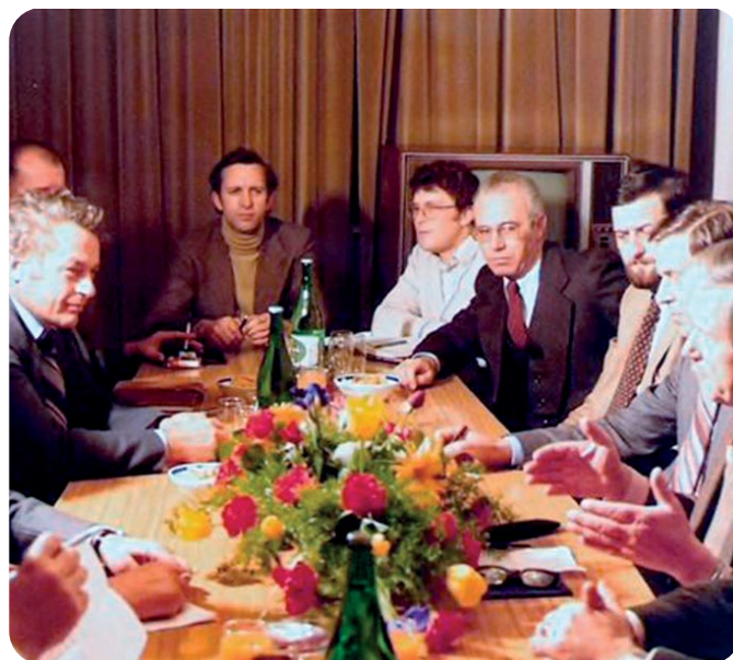
Pogovor ob ločitvi programov RK - C 1979.

»Marsikaj smo si upali. Celo dogodke z Roške ceste smo neposredno prenašali, čeprav jih Radio Ljubljana ni. Preprosto smo se priključili na Radio Študent in prenašali dogajanje. Vojno programsko shemo v času osamosvajanja Slovenije smo v regionalnem centru v Kopru začeli dan prej, ker so se dogodki na Primorskem odvijali prej kot drugod po Sloveniji. Takrat smo bili najbolj poslušani radio, bili smo servis za ostale medije. Za to sem moral sprostiti novinarja, da je lahko servisiral novinarje dopisnike, ki so delali v Kopru in posredovali informacije kolegom v Trstu. Program so neposredno, v živo, vodile novinarke in novinarji, ki so se izmenjavali praktično ves čas vojne.«