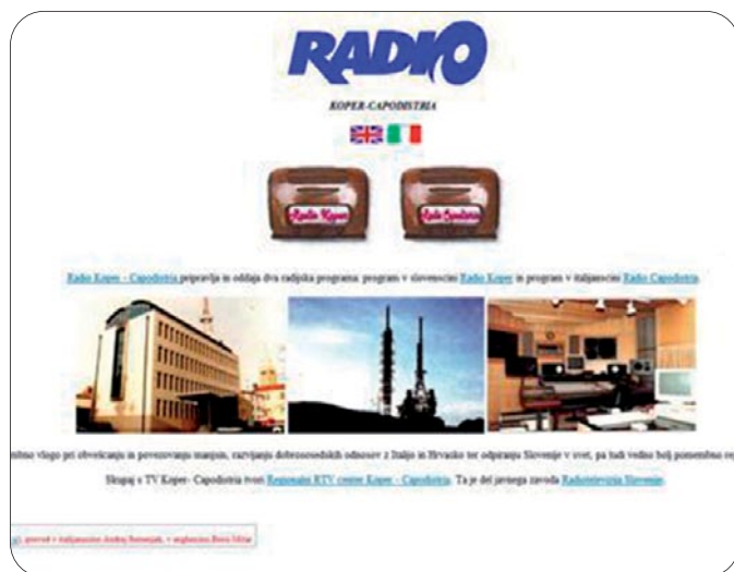
nternetna stran RK-C iz leta 1996.