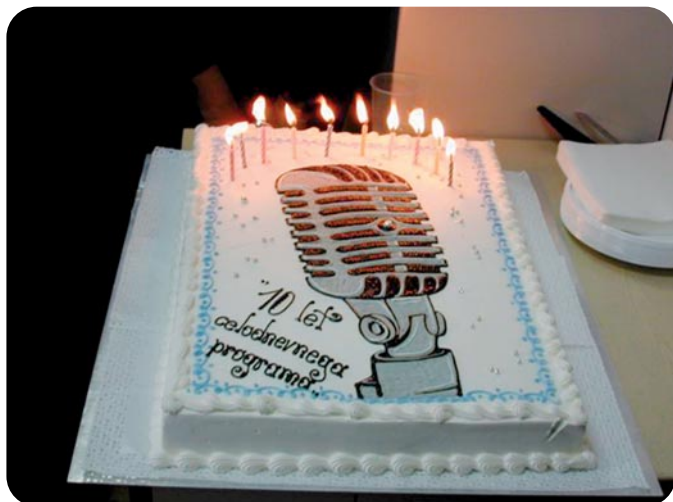
Torta ob 10 letnici celodnevnega programa na RK-C v slovenščini leta 2002.

Že leta 1996 je naredil prvo internetno stran Radia Koper in prvo interaktivno računalniško oddajo Radionet. Napisal in izdal je tudi priročnik o uporabi računalnika. Ob vsem tem je vseeno pripravljaval tudi druge novinarske vrstvi. »Opazil pa sem, da so nekatere posebej motili moji komentarji, nekateri politiki pa so me začeli šteti