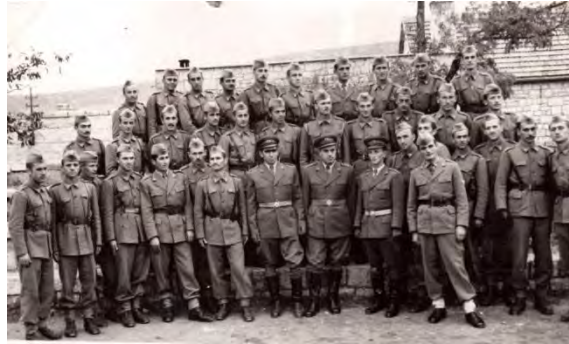
3. vod – Bileća, 1. 11. 1958–20. 3. 1959