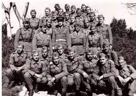
3. vod – Bileća, 1. 4.–20. 9.1959

(Prisutno 4 pitomaca iz drugih voda mitraljeske čete).