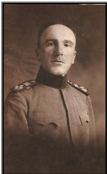
Slika 4. – stotnik VKJ, 1920