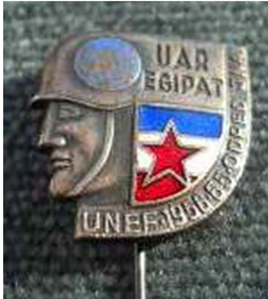
Značka pripadnikov UNEF

Imel sem to srečo, da sem 1962 sodeloval kot pripadnik Odreda JLA v mirovni misiji OZN – UNEF na Sinaju v Egiptu. Šlo je dejansko za prvo mirovno misijo OZN po 2. svetovni vojni, ko so bile marca 1957 mirovne sile UNEF poslane na Sinaj, da po izraelski in francoski-britanski agresiji na Egipt nadzorujejo premirje in bdijo na meji med Egiptom in Izraelom.