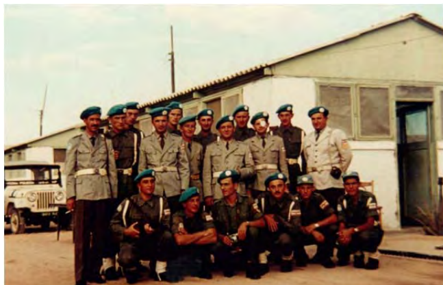
Vod vojaške policije XII. odreda JLA

Moj vod je imel dve zidani baraki: polovico manjše sem delil s poveljnikom pehotne čete, v večji baraki pa so se namestili podčastniki (5) in vojaki – vojaški policisti (13), pa smo tako za službene potrebe lahko formirali 5 policijskih patrolj.