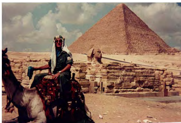
»Obvezna« fotografija pred sfingo in piramido v Gizi

Naslednje dni smo prebili v Aleksandriji. Najprej smo obiskali britansko vojaško pokopališče v El Alameinu in prizorišče znane nemško-britanske tankovske bitke iz 2. svetovne vojne, ko je novembra 1942 britanski general Montgomery premagal nemški afriški korpus generala Rommela. Seveda smo najbolj uživali ob obisku piramid v vasi Gizi, južno od Kaira.