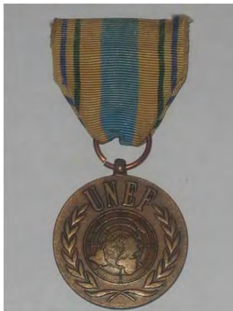
Medalja miru – služenje v UNEF

Pred odhodom nam je predstavnik poveljstva UNEF iz Gaze podelil »Medalje miru«. Nato smo zadnjo večerjo, seveda po naši stari navadi, krepko zalili s pivom in viskijem.