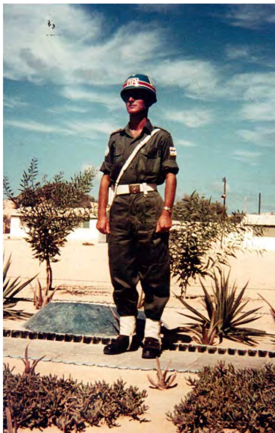
Poveljnik voda vojaške policije XII. odreda JLA (Foto-album MFK, El Ariš, 1962)

pomarančni. Džus je bil seveda zastoj in sčasoma smo postali veliki porabniki. No, nekateri pa so raje preizkušali razne vrste piva, predvsem danskega, ki je bil zelo poceni. Za potrebe reprezentance smo seveda s seboj prinesli nekaj zabojev stare (in močne) srbske slivovke.