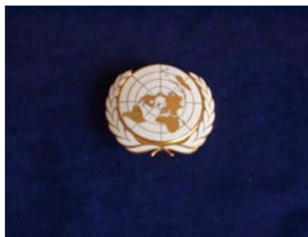
Značka na baretki, kapi in čeladi