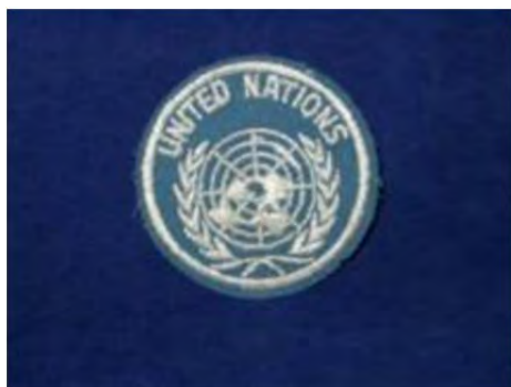
Znak OZN (na levem rokavu)

Izraelsko in francosko-britansko agresijo je obsodil ves svet, pa je zato OZN sprejela sklep, da se morajo agresorske enote takoj umakniti z egiptovskega ozemlja. Radi kontrole umika in vzpostavitve miru je OZN poslala 15. novembra 1956 na Sinaj okrog 6.000 pripadnikov mirovni sil – UNEF.