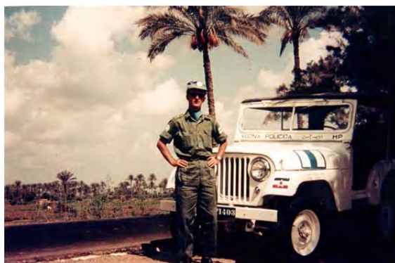
Ismailia ob Nilu – postanek v senci palm