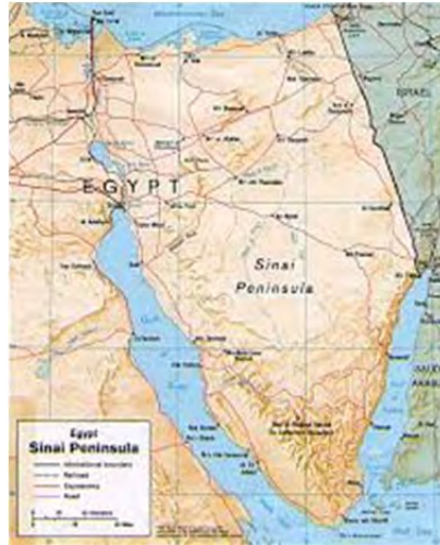
Polotok Sinaj – Egipt

Maja 1967 je izraelska vojska ponovno napadla Egipt. Po sklepu OZN in zahtevi Egipta so se mirovne sile UNEF do 17. junija 1967 umaknile.