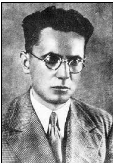
Josip Broz, 1928

Zakaj Tito ni pristopil k jugoslovanskim dobrovoljcem v Omsku?