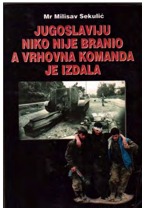
Monografski prvenac, Beograd, 1997

Posle razbijanja SFRJ napisao je dve značajne knjige, i to: Jugoslaviju niko nije branio, a vrhovna komanda je izdala , 1997 i Knin je pao u Beogradu , 2000. Već sami naslovi rečito govore protiv koga je usmerena najoštrija kritika (izdaji GŠ JNA i Miloševićевой politici).