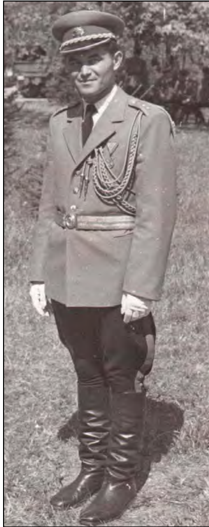
Milisav Sekulić, gardijski poručnik, 1961

Kao odličan komandant i praktičar, pukovnik Sekulić je bio premešten u I. Upravu GŠ JNA, da bi sa svojim iskustvom doprineo naučnom uobličavanju teorijskih i doktrinarnih dokumenata. Ujedno je uspešno završio postdiplomske studije i postao magistar vojne veštine, sa temom Metodologija rada komande armije .