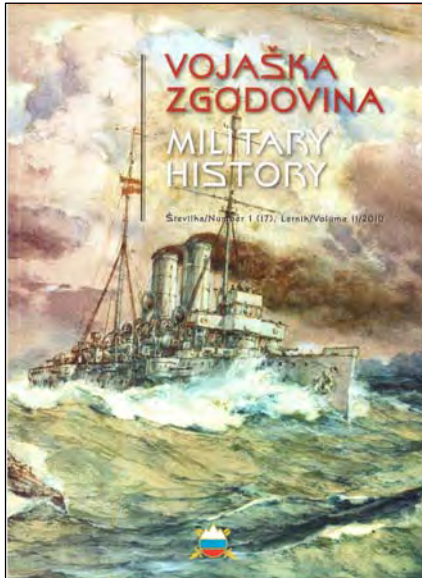
Vojna istorija, Ljubljana, 11/2010

U reviji Vojna istorija (Vojaška zgodovina) , koju izdaje Slovenačka vojska, septembra 2010 objavljeni su članci (studije) trojice autora: