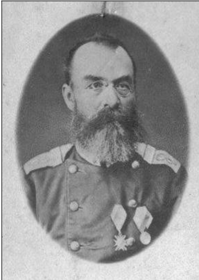
Dr. Stevan Nedok sanitetski major SV, Beograd, 1877

Bio je odlikovan srebrnom medaljom za hrabrost i takovskim krstom za vojničke zasluge (1877). Umro je 4. 5. 1878 u toku drugog rata sa Turskom, posle teške bolesti. Knez Miloš Obrenović ga je zbog izvanrednih zasluga posthumno unapredio u čin sanitetskog potpukovnika, što je bio tada, sve do 1883, najviši čin u sanitetskoj službi srpske vojske.