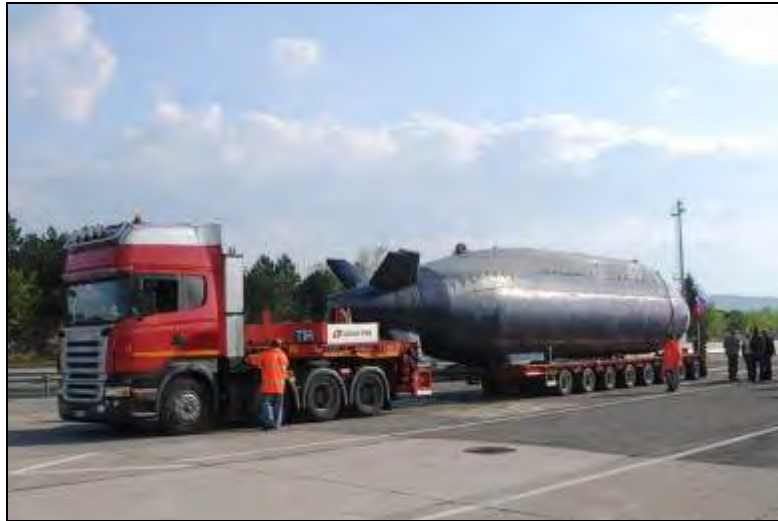
Podmornica na vlačilcu podjetja CEM – TIR v Pivki aprila 2011

Gre za žepno podmornico iz razreda »Una«, dolgo 19 metrov in težko 76 ton, zgrajeno 1980 v Jugoslaviji, ki je tudi plod slovenske pameti in (bivše) vojaške industrije, zlasti elektronske (Iskra). Torej, gre tudi za tehnični spomenik!