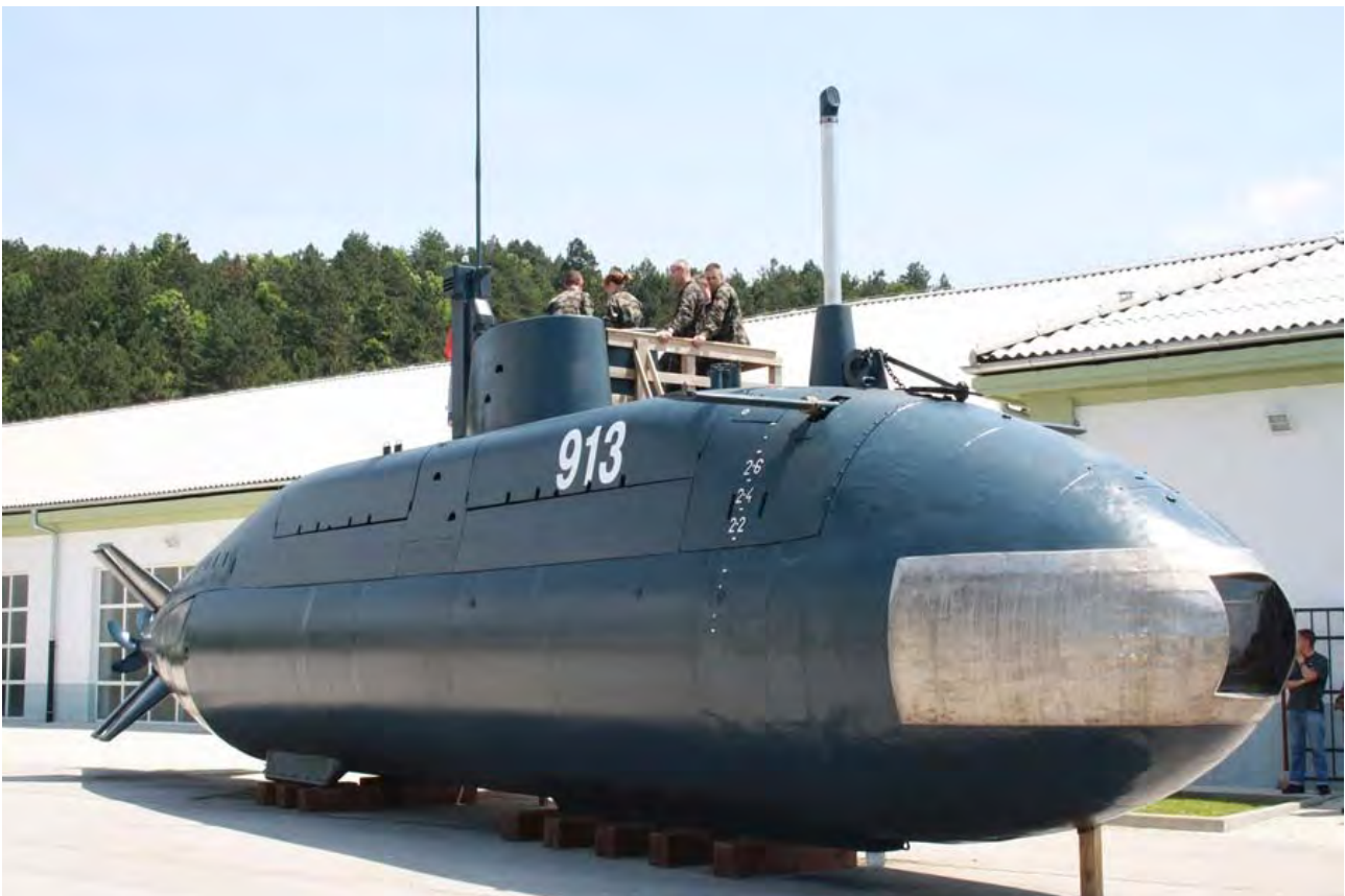
Podmornica P-913 ZETA