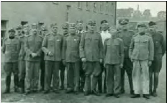
Generali - ujetniki, OL (drugi z desne), Osnabruck, 1942