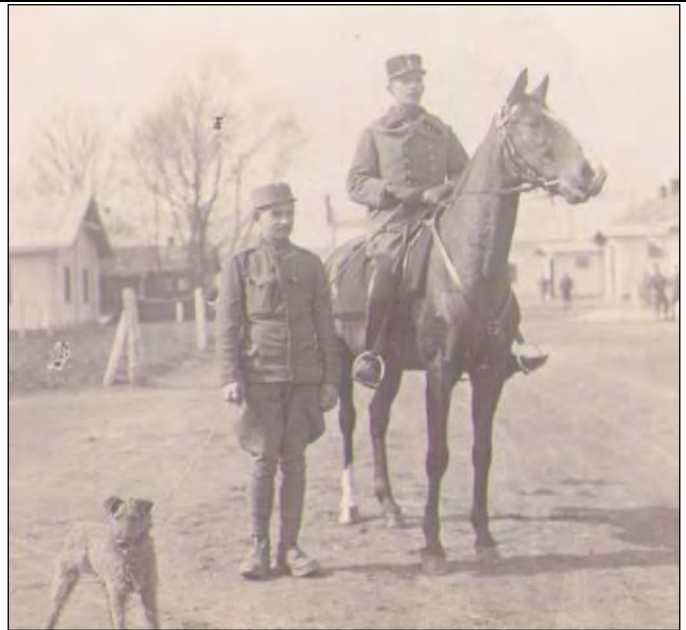
Kapetan Otmar Langerholz s posilnim, okrog 1914