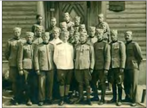
Generali - ujetniki, OL (četrti z leve), Osnabruck, 1942