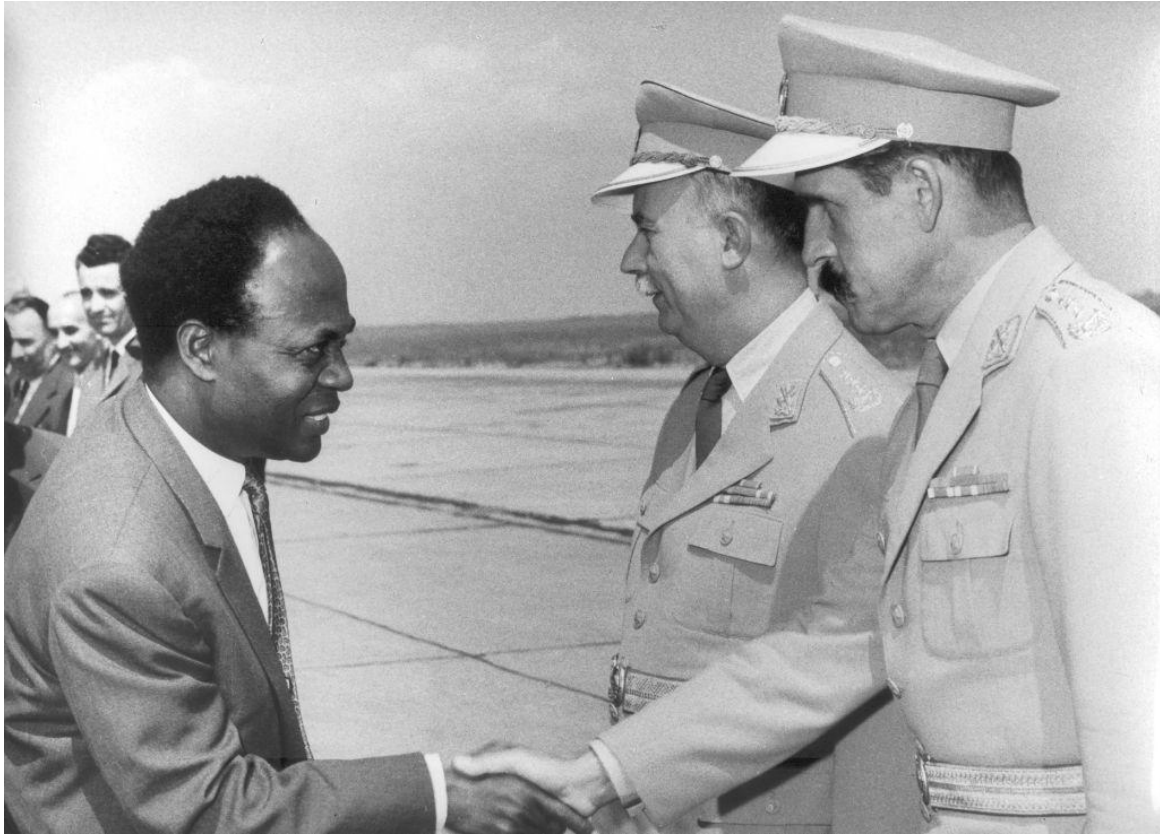
Pozdrav s Kennethom Kaundo, prvim predsednikom Zambije.