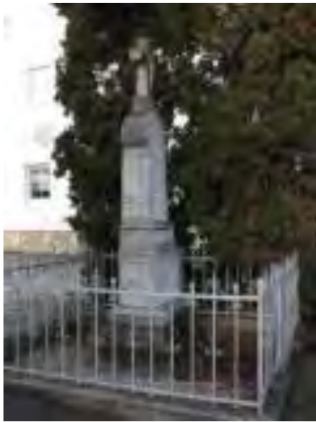
Spomenik udeleženem v 1. SV, Brežice, 1919.

Na spomeniku je vklesano naslednje besedilo: