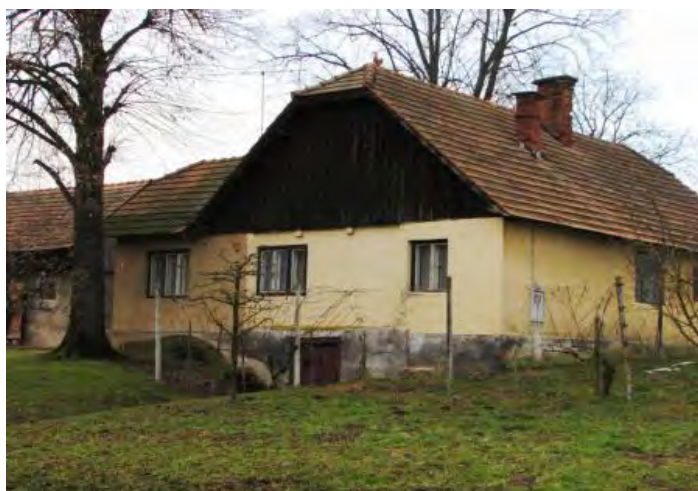
Stara domačija P'r Krajáčič (od 1798) v Trnju št. 3.

živel sredi 17. stoletja na tem področju 14 družin z vsemi zgoraj zapisanimi različicami priimka Kreačič.