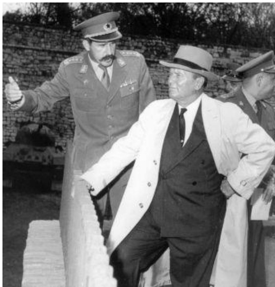
Zgoraj desno: na Kalemegdanu, Beograd, 1961: Tito, Otmar Kreačič in Ivan Gošnjak v ozadju. Iz družinskih albumov.

Što je to ustvari bilo? Naime, u partijskom mehanizmu nije bilo moguće reći „ ako je komisija u pravu “ jer je komisija upravo zato i bila formirana, da se dokaže ono što je već bilo unaprijed zaključeno. Striko je pravilno ocijenio da se je u biti radilo o borbi na vrhu vlasti, a imao je i bliske odnose sa Rankovićem. Međutim zbog svoje prošlosti i ličnog integriteta zadržao ugled u društvu sve do svoje smrti 1992. g.« 13