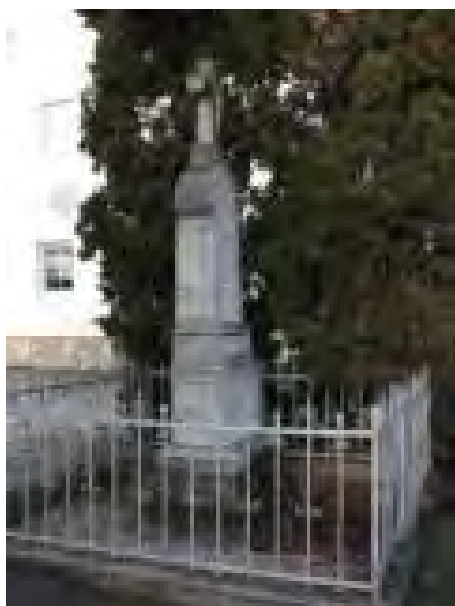
Spomenik udeležencem v 1. SV, Brežice, 1919.