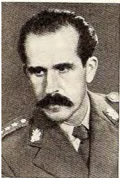
Otmar Kreačič - Kulturo, generalpolkovnik (Vojna enciklopedija, Beograd, 1961)

generalpolkovnik in narodni heroj slovenskega rodu