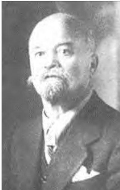
Jože Srebrnič (1884–1944)