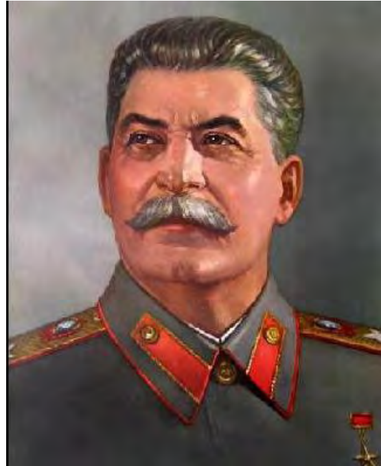
Josip Visarijonovič - Stalin (1878–1953)