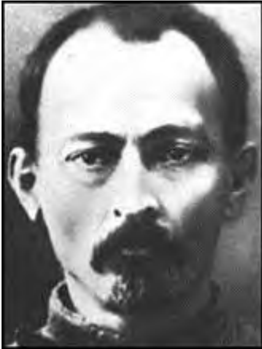
Feliks Edmundovič Dzeržinski