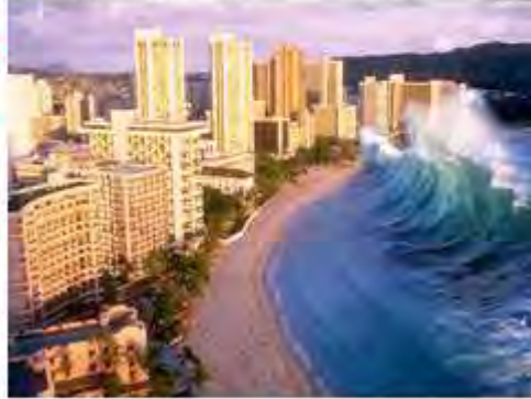
udar plimnega vala ?