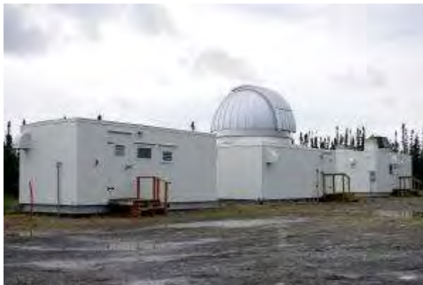
Center HAARP na Aljaski, ZDA