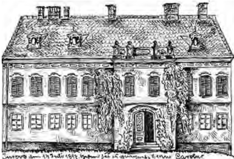
Graščinski dvorec Jurovo, 1897 (Zasebna zbirka, Janez Majzelj, Novo mesto)