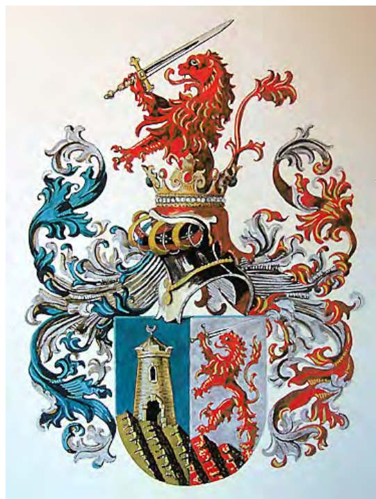
Grb pl. Livnograd